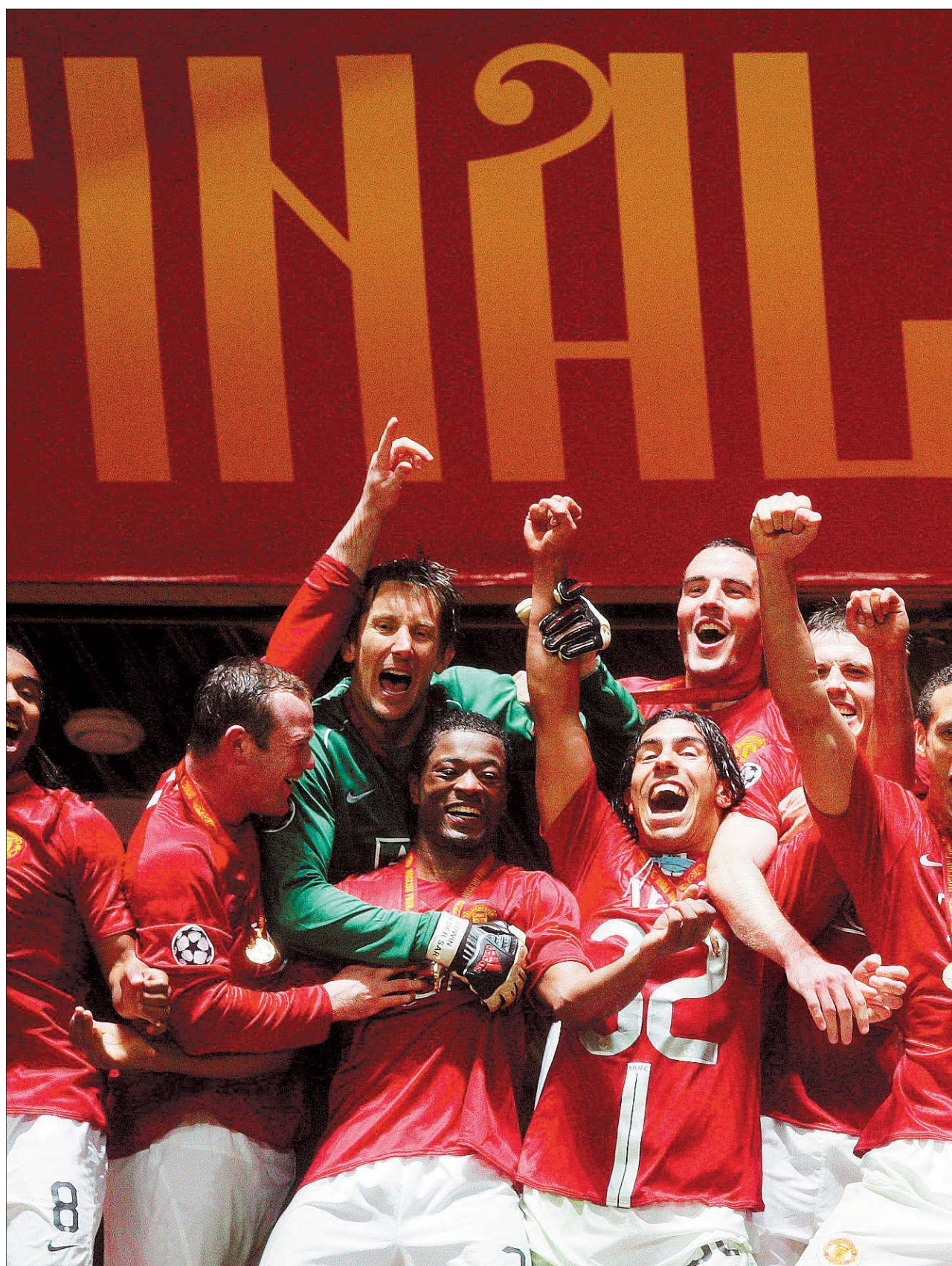
Los jugadores del Manchester United celebran su triunfo con la copa conquistada en Moscú.

El equipo londinense dominó a placer, con Lampard y Ballack como pulmones, mientras los del Manchester se limitaban a defenderse como 'gato panza arriba'.